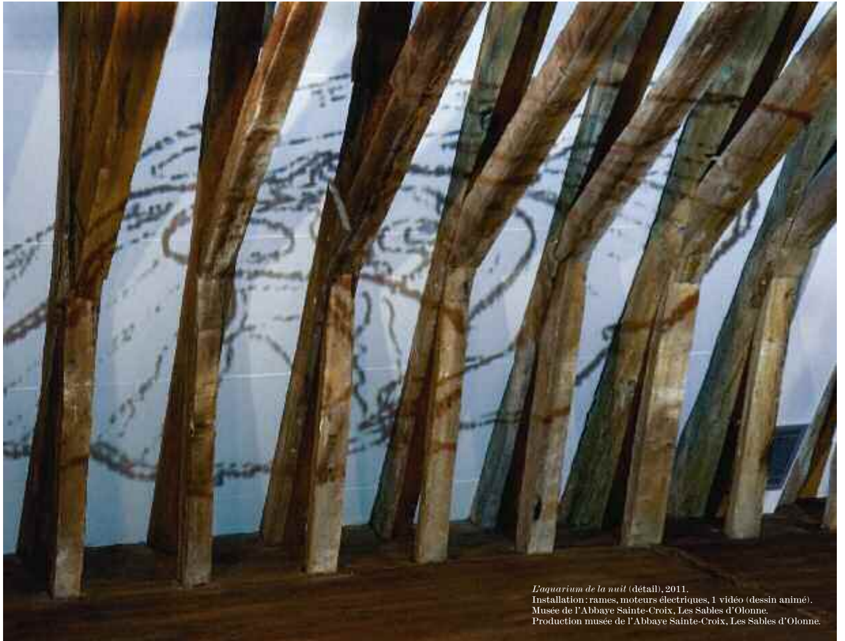
Eaquarium de la nuit (détail), 2011. Installation : rames, moteurs électriques, 1 vidéo (dessin animé). Musée de l'Abbaye Sainte-Croix, Les Sables d'Olonne. Production musée de l'Abbaye Sainte-Croix, Les Sables d'Olonne.