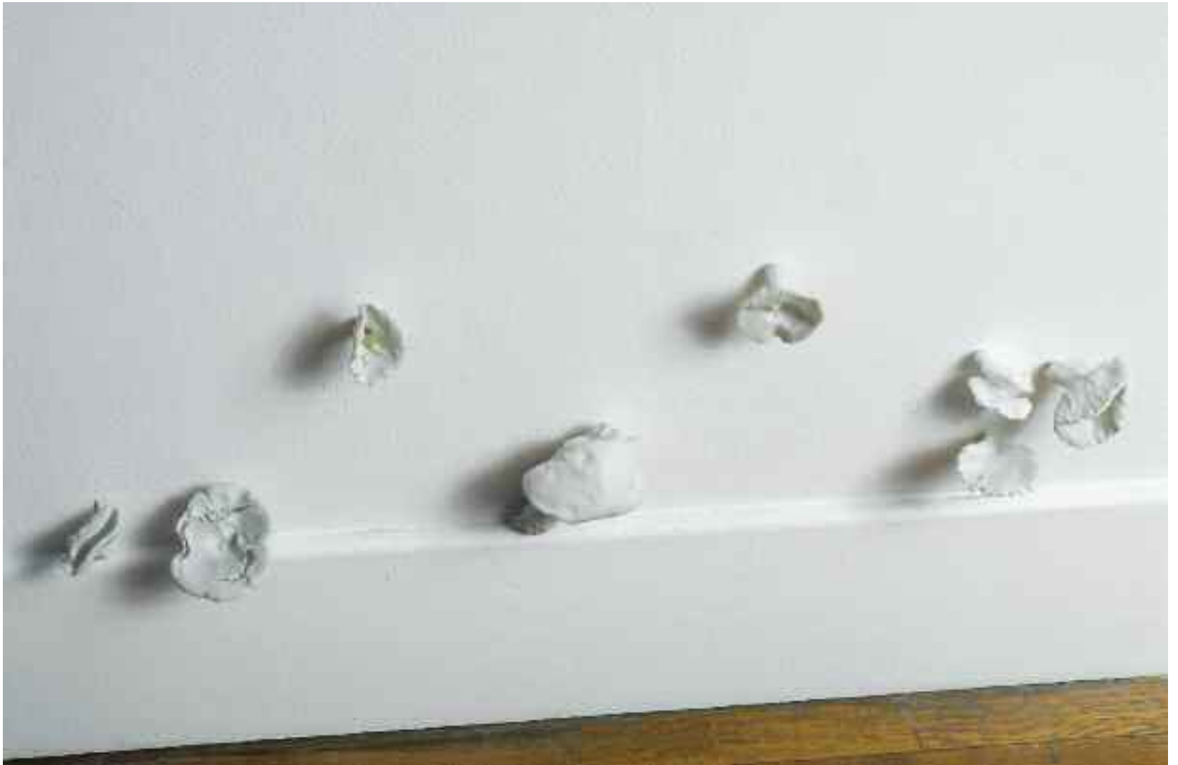
Un décor approprié (détail), 2011. Installation : champignons en porcelaine, vidéo (dessin animé). Musée de l'Abbaye Sainte-Croix, Les Sables d'Olonne. Production Centre d'art contemporain Chapelle Saint-Jacques, Saint-Gaudens / École supérieure d'art et céramique, Tarbes.