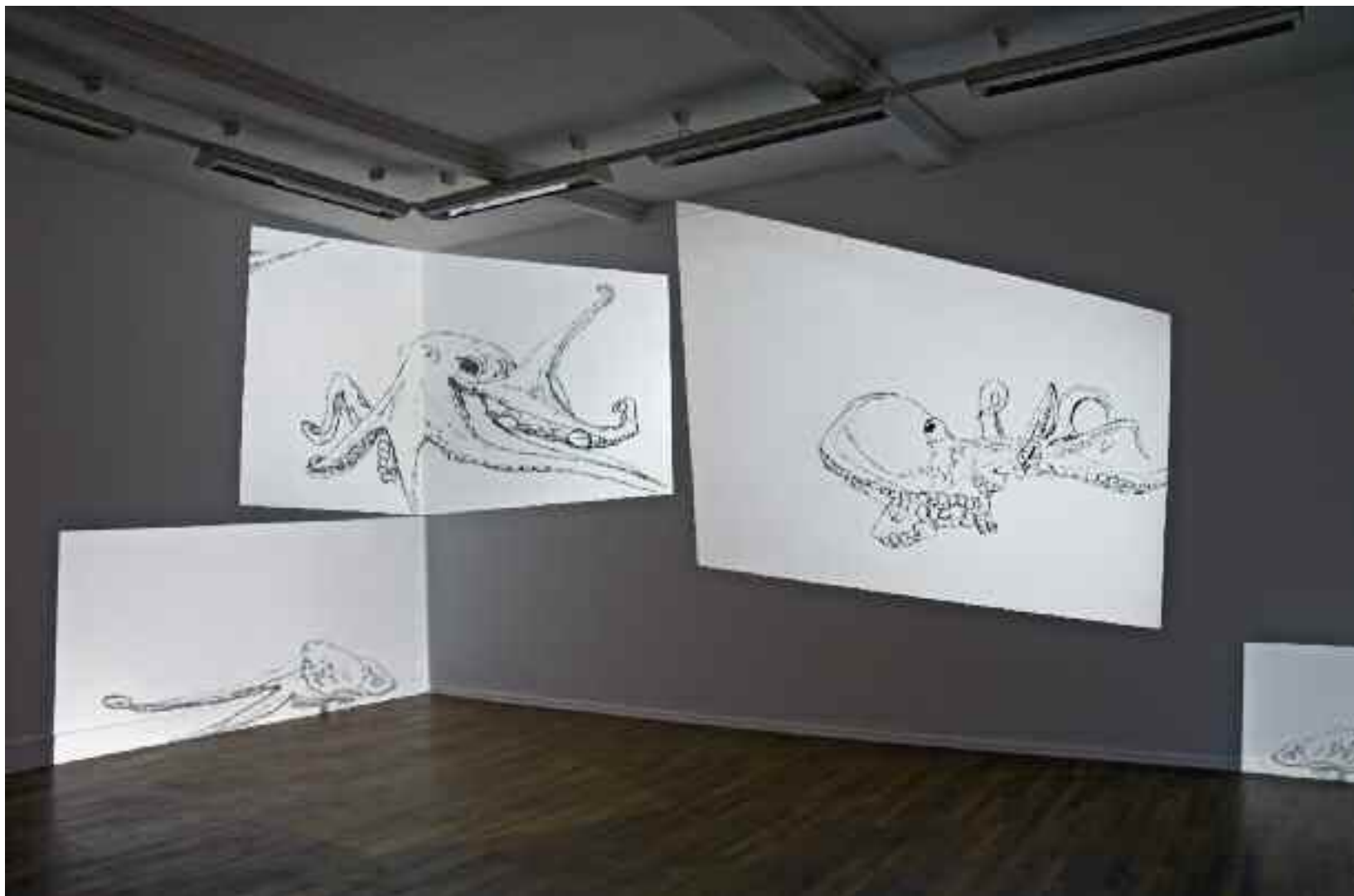
Ce fut une épopée de géants , 2011. Installation: 3 vidéos (dessins animés). Musée de l'Abbaye Sainte-Croix, Les Sables d'Olonne.