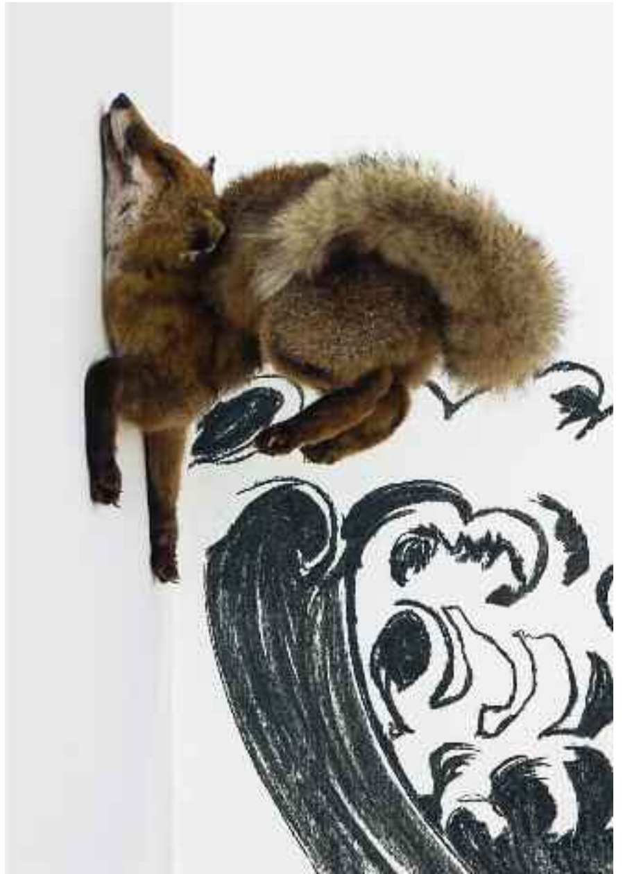
La Vague de l'océan (et détail), 2011. Installation : renards naturalisés, dessins au fusain. Musée de l'Abbaye Sainte-Croix, Les Sables d'Olonne. Production musée de l'Abbaye Sainte-Croix, Les Sables d'Olonne.